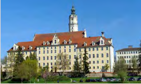
Wallfahrtskirche Heilig Kreuz und «Cassianeum»