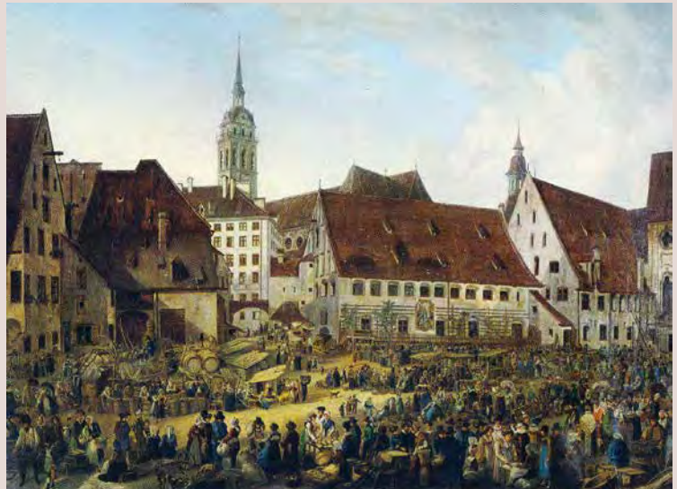
München um 1825 (Domenico Quaglio*)

9 Die drei Grazien von Canova befinden sich aktuell in der Eremitage in St. Petersburg. Sie kamen im Rahmen der Heirat von Sohn Maximilian mit der Grossfürstin Maria Nikolajewna nach Russland.