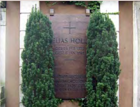
Grab von Baumeister Elias Holl

10 Gottesacker: Auf dem protestantische Friedhof in der Nähe des Roten Tores, ausserhalb der Stadtbefestigung, befinden sich die Gräber berühmter Augsburger wie z.B. Baumeister Elias Holl.