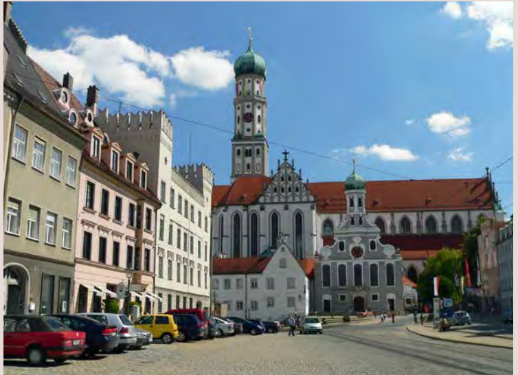
St. Ulrichs-Kirche vor der Basilika St. Ulrich und Afra