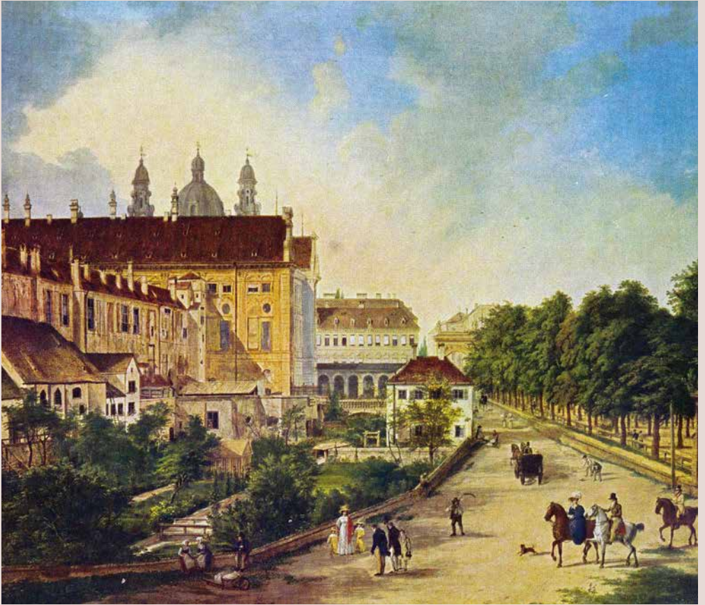
Nordseite der Residenz um 1820 (Domenico Quaglio*)