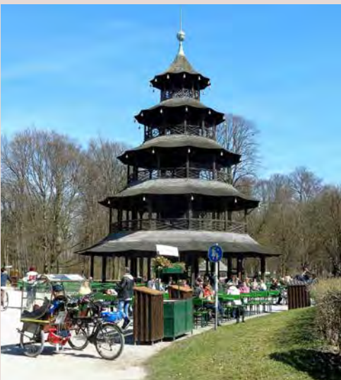
Chinesischer Turm im englischen Garten

Nach wie vor im Museum ist das grosse Bodenmosaik aus Mittelitalien, das auf die Zeit von 200/250 BC datiert wird. In der Mitte steht der Ewigkeitsgott Aion (Äon) im Himmelskreis mit den Tierzeichen. Rechts sitzt die Erdmutter Tellus mit ihren vier Kindern, welche die vier Jahreszeiten verkörpern.