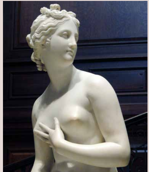
«Paris» mit dem Apfel und rechts die «Venus»

4 Glyptothek: Schumann erlebt den Bau des für die Antikensammlung von Kronprinz Ludwig seit dem Jahr 1816 durch Leo von Klenze konzipierten Vierflügelanlage am Königsplatz in der letzten Phase (Eröffnung 1830). Die Venus war vermutlich ein Exemplar aus dem Atelier von Canova, Paris hingegen wurde in die Sammlung der Neue Pinakothek integriert.