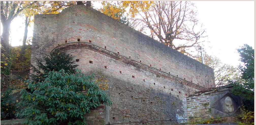
Bastion «Lug ins Land»

«MARTIN LUTHER soll an dieser Stelle durch eine Pforte in der Nacht zum 21. Oktober 1518 heimlich die Stadt verlassen haben».