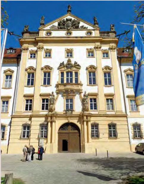
Eingangsfassade des Schlosses

Sofort nach der Übernahme durch von Wrede lässt er die Residenz von französischen Handwerkern neu möblieren und mit seltenen Seidentapeten versehen. Erst 1939 wurden Teile des riesigen Komplexes vom Land Bayern erworben. Das Fürstenhaus hatte aber nach wie vor das Wohnrecht im Ostflügel des Schlosses.