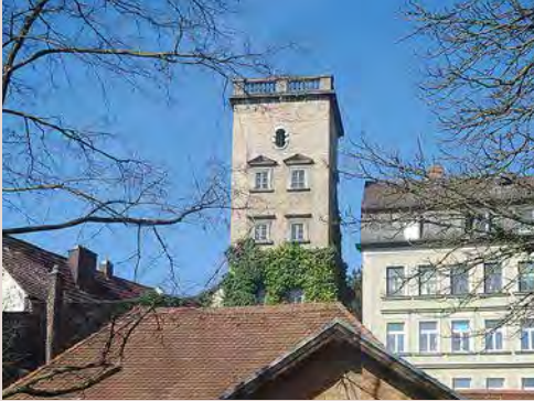
Der Turm der Wassersäulenmaschine

7 Die Reichenbachische Wassermaschine: Schon im Mittelalter waren die aus Holz gefertigten Wasserhebemaschinen von Augsburg unter dem Begriff «Machina Augusta» in Europa bekannt. 1821 wurde die von Georg Friedrich von Reichenbach entwickelte Wassersäulenmaschine aus Gusseisen in Augsburg eingesetzt, um die Stadt mit Wasser zu versorgen. Schumanns Besuch galt also einer topaktuellen Neuerung, die erst 1865 wieder modernisiert werden musste.