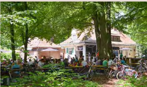
Siebentucher oder Siebentischwald

1 Ablass: Der Hochablass ist ein Stauwehr, welches das Wasser vom Lech abzweigt und zusammen mit dem Stadtbach in der Altstadt die Kanäle des Lechviertels speist. Seit dem Jahr 1346 ist ein Wehrdamm urkundlich belegt. Er sorgte verschiedentlich für Streit mit dem bayerischen Herzögen. Kriege und Hochwasser richteten über die Jahrhunderte verheerende Schäden an. Die von Schumann besuchte Anlage wurde erst 1911 massiv neu gebaut.