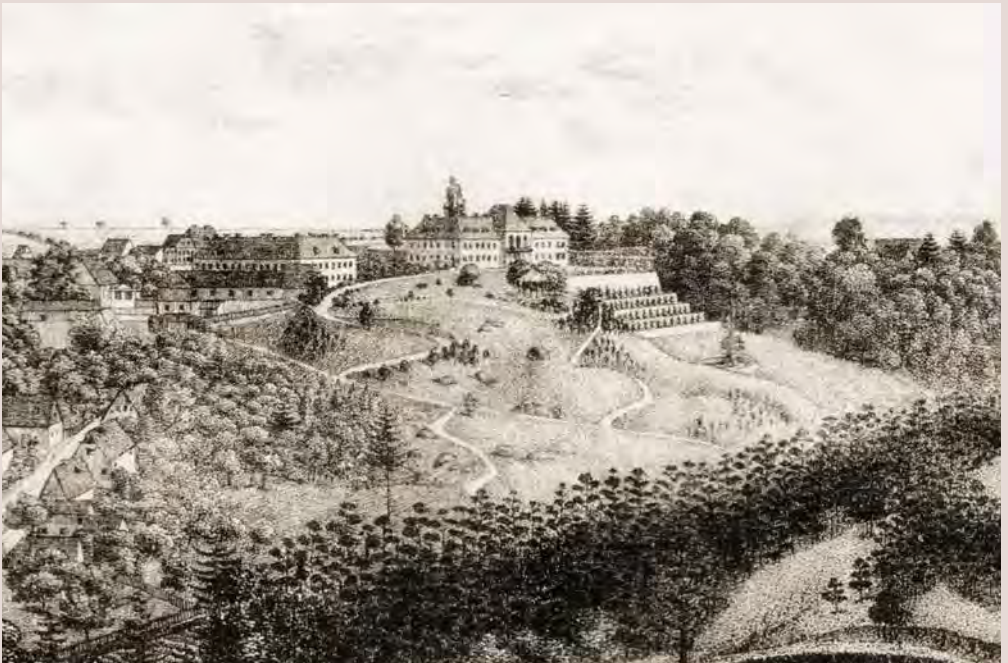
Schloss Fantaisie mit Gartenanlage und Rebberg um 1820

Friederike Sophie, die von 1732 bis 1780 lebt. Als Tochter der Markgräfin Wilhelmine von Bayreuth wird sie jung verheiratet und kehrt nach wenigen Jahren nach Bayreuth zurück. Den Sommer verbringt sie jeweils zusammen mit Gästen und ihrem Hofstaat in diesem Refugium. Heute beherbergt das Gebäude ein Museum für Gartenkunst.