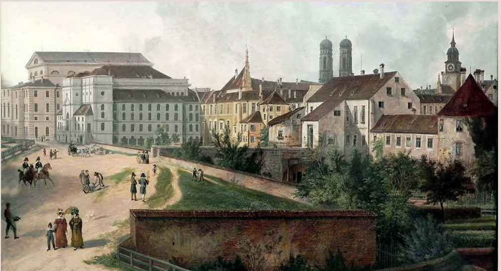
Residenz um 1825 (Domenico Quaglio*)

* Domenico Quaglio wurde 1787 in München geboren und starb 50-jährig auf Hohenschwangau. Seine Gemälde dokumentieren die Metropole vor der grossen Umgestaltung zur Königsresidenz, die Ludwig I. veranlasste.