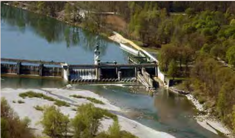
Der Ablass an der Lech vor Augsburg

Montags, den 5. Mai: Abfahrt nach München