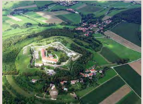
Festung Weissenburg (Wülzburg)

2 Festung Weissenburg: 1588 an der Stelle eines ehemaligen Klosters in fast uneinnehmbarer Lage erbaut und unter dem Namen Wülzburg bekannt. Von der Strasse nach Weissenburg aus als Höhenfestung bestens zu erkennen.