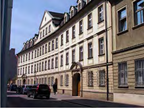
Hier befand sich die Cottaische Dampfdruckerei

9 Cottaische Dampfdruckerei: Der Verleger Johann Friedrich Cotta richtete 1824 die erste mit einer Dampfmaschine betriebene Schnellpresse ein. 20 Jahre später stellten die neusten fünf Maschinen bereits 65'000 beidseitig bedruckte Zeitungsbögen her. Das Haus an der Karmelitengasse steht trotz Kriegsschäden immer noch.