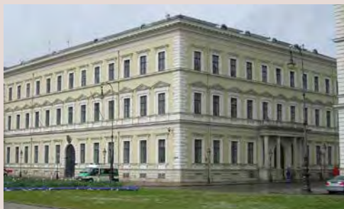
...und Odeon von Leo von Klenze

3 Odeonssaal: Auch das Odeon wurde von Klenze erbaut, und zwar als Konzert- und Ballsaal und erst noch mit der spiegelbildlichen Fassade zum Palais Leuchtenberg. Nach der Kriegszerstörung verzichtete man auf die Wiederherstellung des Konzertsaaes. Dafür übernahm das Innenministerium das neue Gebäude.