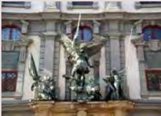
Schaufassade vom Zeughaus

4 St. Ulrichs-Kirche: Eine in Europa vermutlich einmalige Kombination von einer evangelisch-lutherischen Kirche und einer römisch-katholischen Basilika. Die Maximilianstrasse, Augsburger Prachtstrasse, führt direkt auf die in der ehemaligen Vorhalle zur Kirche St. Ulrich und Afra eingebaute evangelische Kirche zu. Der 93 m hohe Zwiebelturm der katholischen Basilika ist von weit her sichtbar. Die beiden Kirchen stehen im rechten Winkel zueinander, haben aber keine Verbindung.