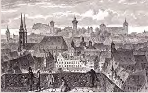
Aussicht auf die Burg um 1830