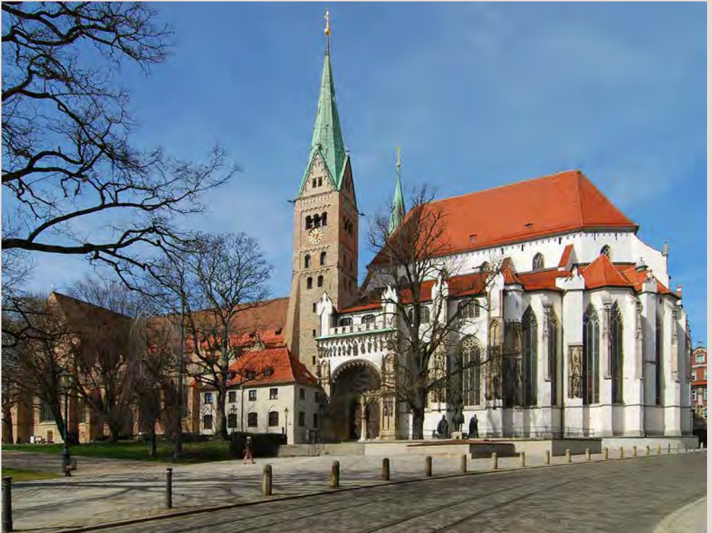
Der Augsburger Dom

8 Der Dom: Er befindet sich innerhalb der mittelalterlichen Stadtmauer. Die Anlage ist jünger als die Basilika mit der Verehrung der Heiligen Afra.