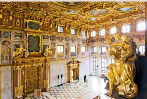
Der goldene Saal im Rathaus von Elias Holl

11 Der goldene Saal: Stadtbaumeister Elias Holl realisierte den repräsentativen Bau des neuen Rathauses in den Jahren 1615–20. Für der Goldene Saal im 2. Stock mit seinen 14 m Höhe brauchte er nochmals fünf Jahre. Das grosse Deckengemälde zeigt im ovalen Mittelbild den Triumphzug der Sapientia (Weisheit), eingerahmt von zwei Rundbildern. Links mit der Architectura (Baukunst) zusammen mit dem Architekten Elias Holl, rechts mit der Minerva Bellona (Wehrbereitschaft). Acht kleine Ovalbilder symbolisieren auf der einen Seite das Streben nach Wissen, Fleiss und Fruchtbarkeit, die Arbeitsamkeit und die Frömmigkeit. Auf der anderen Seite sind es die Heilkunst, die Redlichkeit, die Gerechtigkeit und den Wohlstand. Im 2. Weltkrieg wurde das Raumwunder total zerstört und konnte erst nach jahrelanger, kostspieliger Arbeit von Spezialisten im Jahr 1996 fertiggestellt werden.