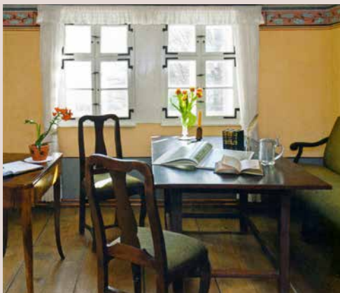
Studierstübchen in der Rollwenzlei

2 Jean Pauls Grab: Es befand sich ursprünglich am Weg zur Fantasie und wurde von einem Sandstein-Obelisken geschmückt. Erst 1863, zum hundertsten Geburtstag, ersetzte man ihn durch einen Findling aus dem Fichtelgebirge. Auf der Grabplatte erscheint auch der Name des früh verstorbenen Sohnes von Jean Paul.