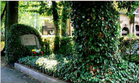
Grab von Jean Paul

2 Jean Pauls Grab: Es befand sich ursprünglich am Weg zur Fantasie und wurde von einem Sandstein-Obelisken geschmückt. Erst 1863, zum hundertsten Geburtstag, ersetzte man ihn durch einen Findling aus dem Fichtelgebirge. Auf der Grabplatte erscheint auch der Name des früh verstorbenen Sohnes von Jean Paul.