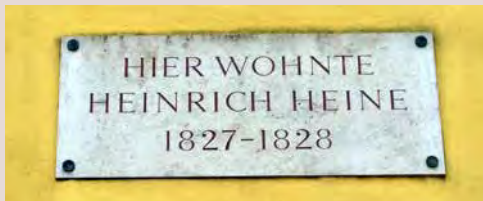
Inschrift am Radspielerhaus